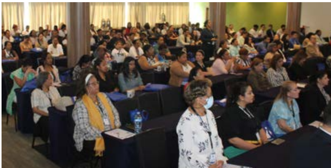
Participaron médicos, enfermeras y profesionales de salud de todo el país