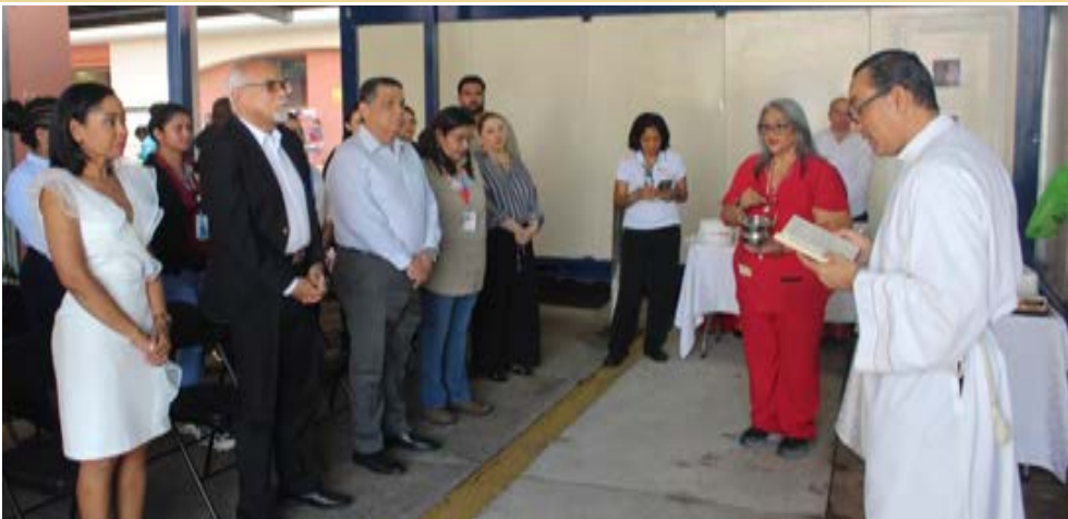
Es un beneficio para los colaboradores quienes recibirán atención en consultas de urgencias, de odontología general, limpiezas dentales, calzas de resina y extracciones, en un ambiente cómodo.