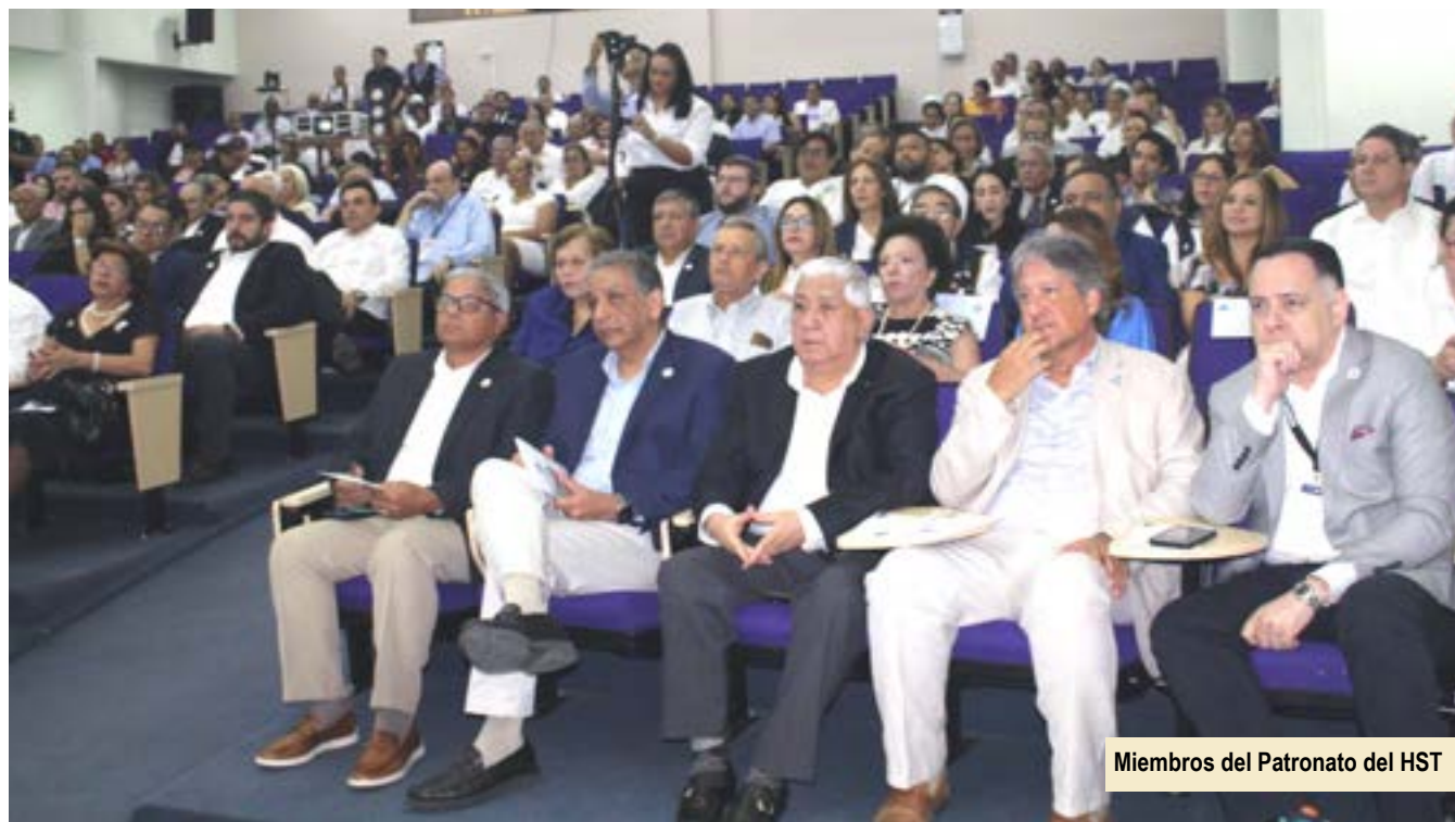
Miembros del Patronato del HST