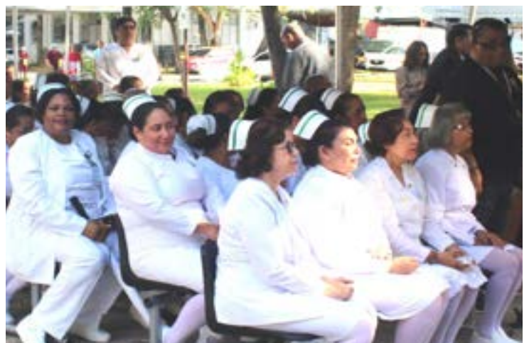
La Misa por el Centenario, celebrada en la capilla ubicada en los jardines, se transmitió en cadena nacional de televisión.