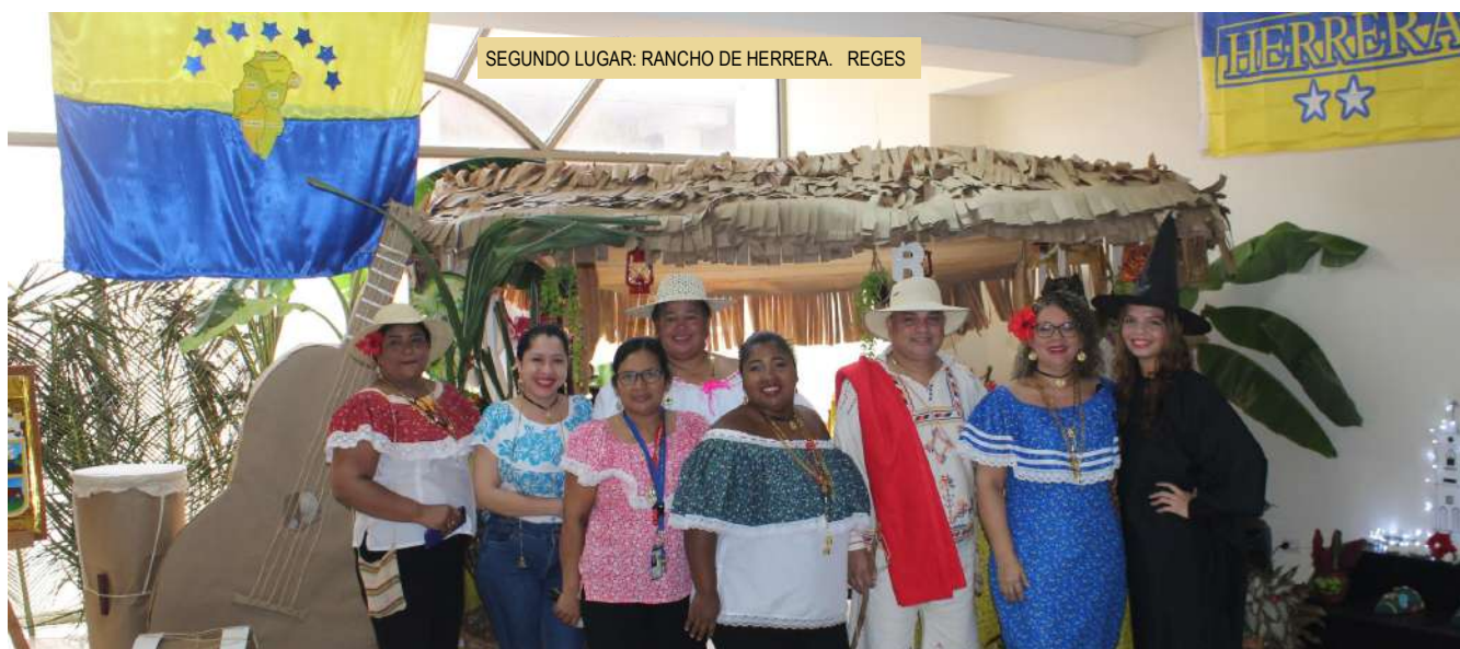
SEGUNDO LUGAR: RANCHO DE HERRERA. REGES