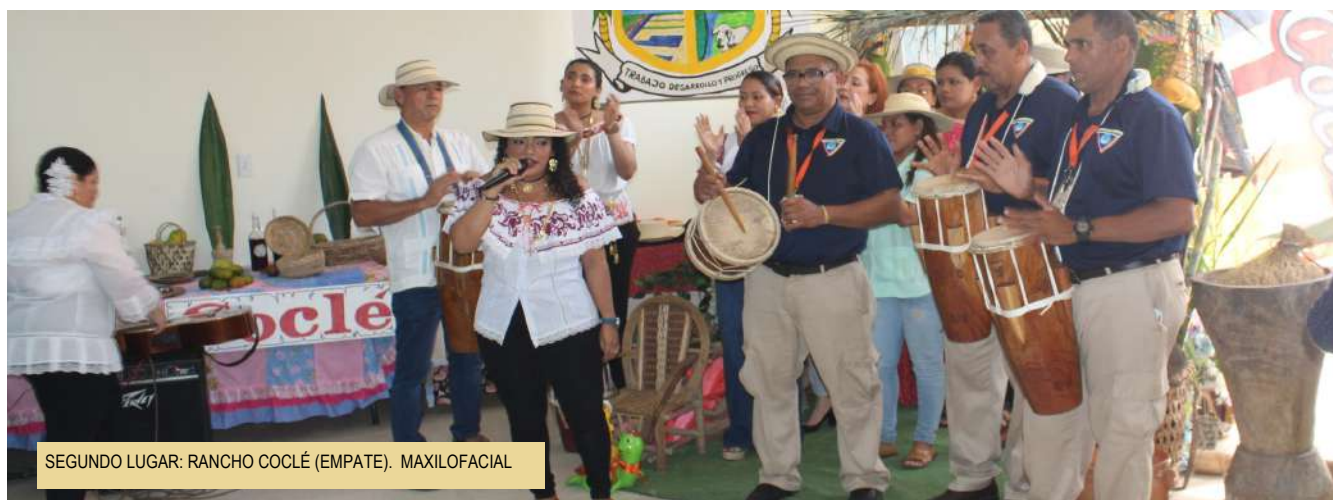
SEGUNDO LUGAR: RANCHO COCLÉ (EMPATE). MAXILOFACIAL