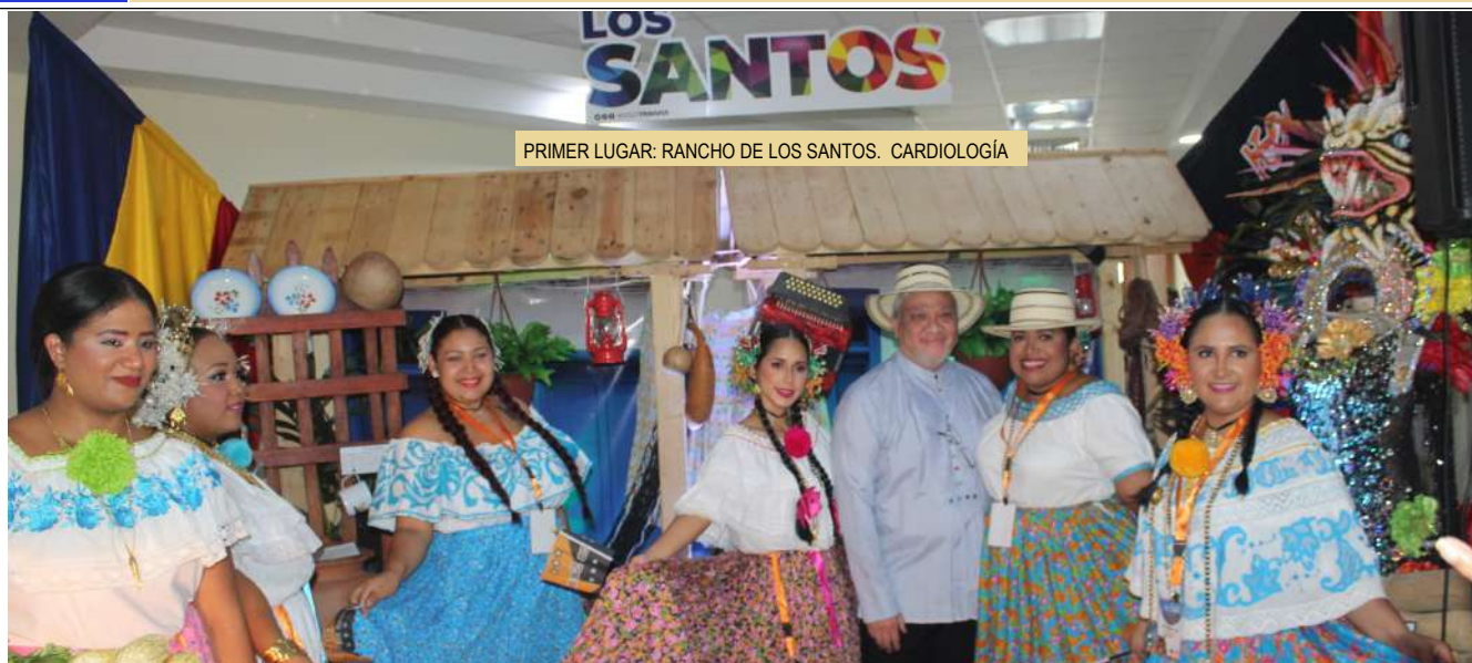
PRIMER LUGAR: RANCHO DE LOS SANTOS. CARDIOLOGÍA